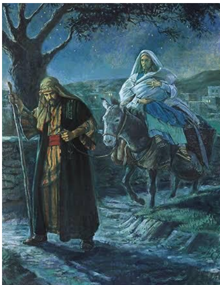
Huída a Egipto Mateo 2, 13-15;19-21