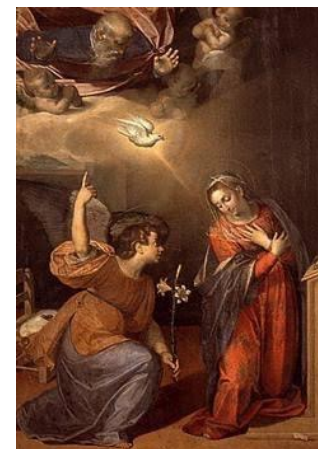
Anunciación. Lucas 1, 26-38

Imprime en grande este tríptico, para vivir en Familia esta celebración sacramental. Cada cita Bíblica la puedes meditar con cada uno de los enfoques.