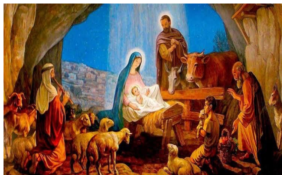
Nacimiento de Jesús Lucas 2, 1-20

Enfoque: Alegría Sentimiento de gozo de los pastores por la venida de Jesús. Hoy, ¿cómo comparto con todos esta alegría del Nacimiento de Jesús?