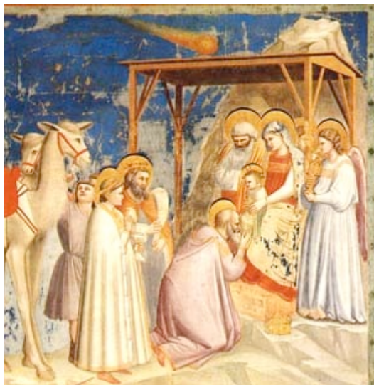
Adoración de los Magos. Mateo 2, 1-12