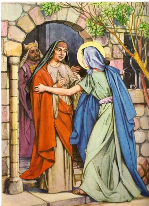
Visita de María a Isabel Lucas 1, 39-56

Enfoque: Confianza Es la seguridad en el Señor que descubro en el encuentro entre María e Isabel, ¿cómo me animan a imitarlas?