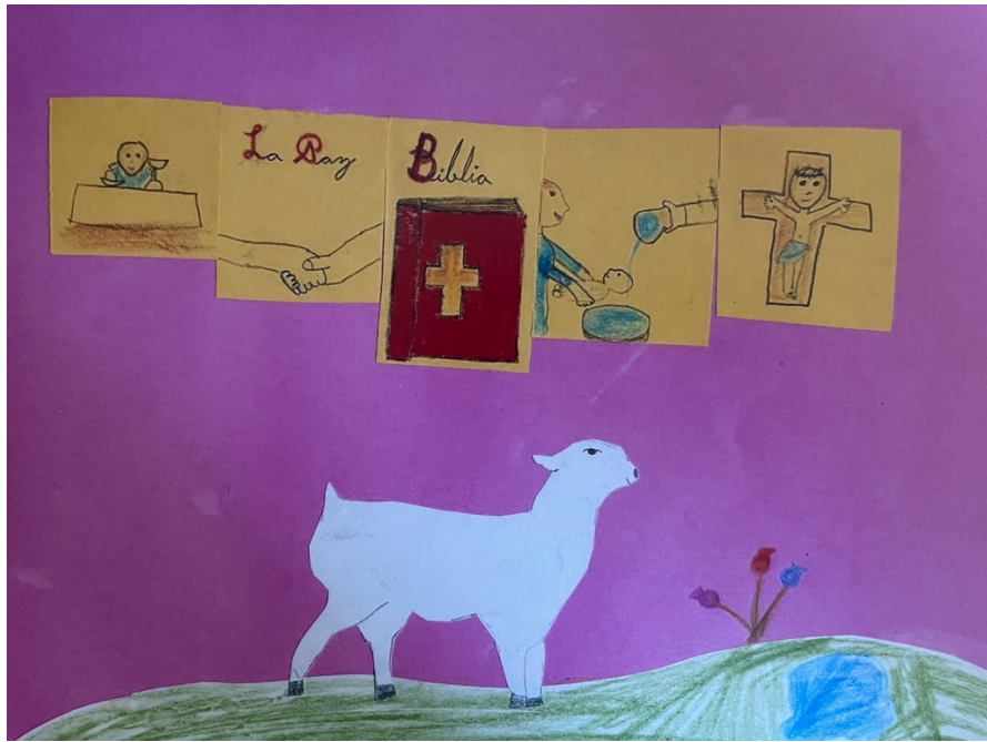
Natalia, Nivel II, León, Gto.

Una oveja, que está parada sobre un prado verde lleno de vida (con hierba fresca, flores multicolores, agua) levanta la cabeza escuchando un llamado o reflexionando sobre los momentos que aparecen en la parte superior. Puede verse sobre ella dibujados en color amarillo (color próximo a la luz, alegría, felicidad) cinco momentos: